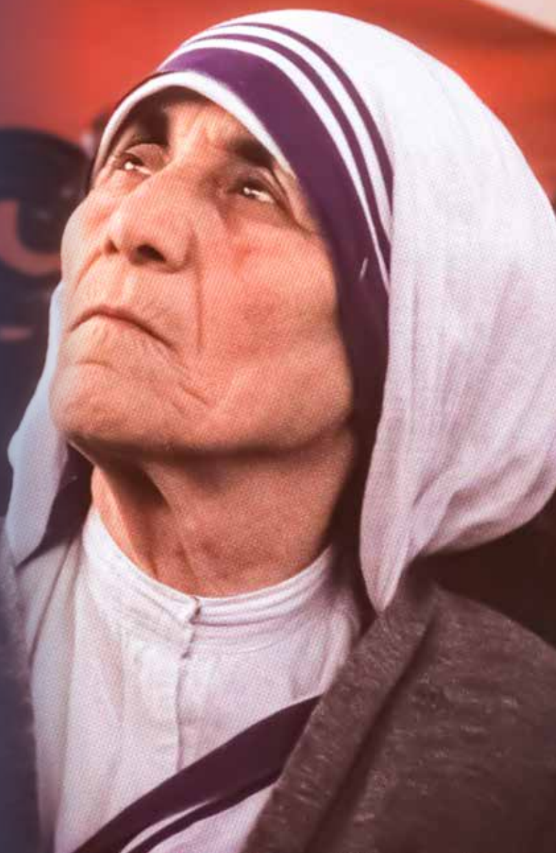
Santa Teresa de Calcutá

a qualquer momento via PIX através da chave pix@acn.org.br ou por meio de nossas contas bancárias: